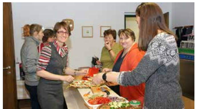
Vorbereitung auf den gemütlichen Ausklang im Pfarrheim